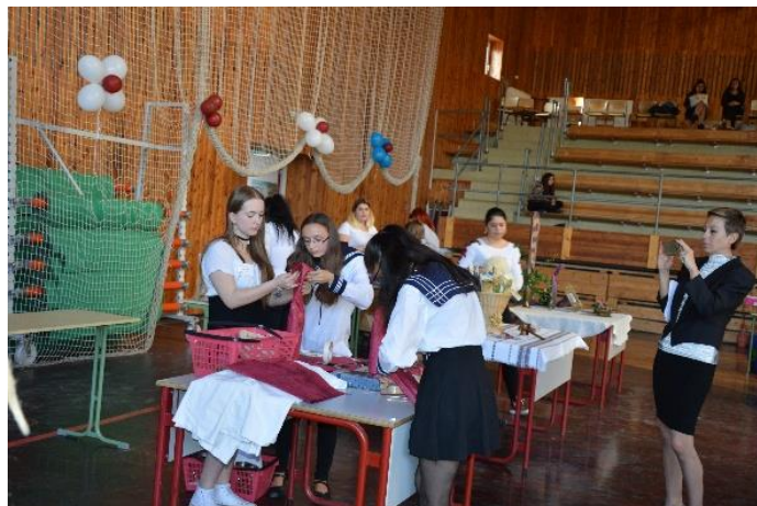
A kép a Garai Szakmai versenyen készült

Képzési idő: 3+2 év 3 szakképzési + 2 érettségi vizsgára felkészítő évfolyam Elméleti és gyakorlati képzési idő aránya: 30%-70% Összefüggő szakmai gyakorlat: 9. és 10. évfolyam után 140 óra Iskolai előképzettség: alapfokú iskolai végzettség Választható idegen nyelv: német vagy angol